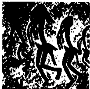
Наскельні зображення первісних танцюристів