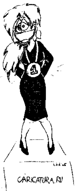
ЛИКА. Молчание - золото!

Вполне очевидно то, что язык, прежде всего, выражается в его продуктивных свойствах, в способности противостоять различным проявлениям несправед-