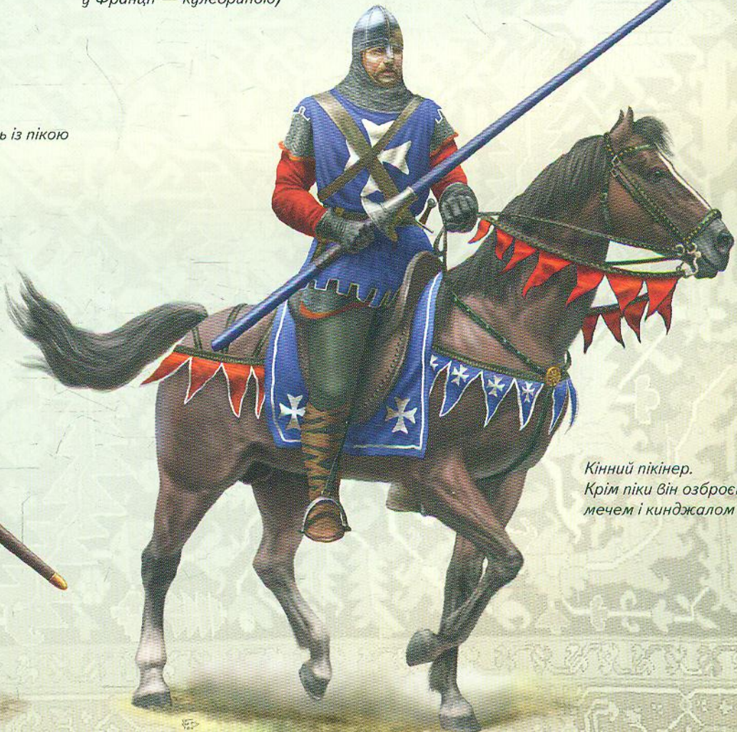
Кінний пікінер. Крім піки він озброєний мечем і кинджалом