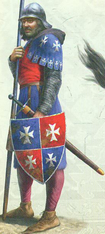
Піхотинець із пікою