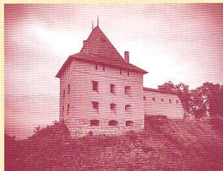
Сучасний вигляд Галицького замку

Князь, що правив у Переяславі, Новгороді, Чернігові, Галичі й Києві (звідки 1239 року поїхав на Захід, шукаючи допомоги в боротьбі з монголами). Був страчений за наказом Батия, коли прибув у Сарай, щоби підтвердити князівський статус після потрапляння руських міст під владу орди.