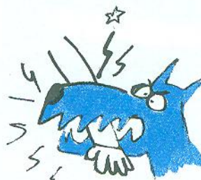
☆ укуси собаки