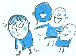
коли з мене кепкують