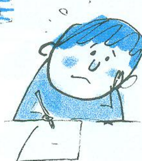
коли в мене щось не виходить