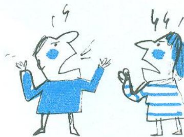
коли сваряться батьки