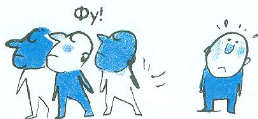
мене не люблять