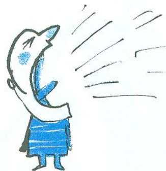
люди, які кричать