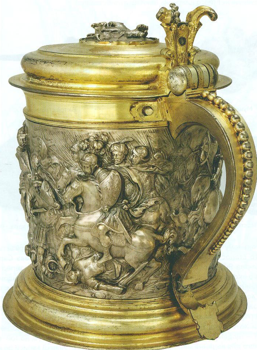
Кухоль із зображенням битви проти османів. Кенігсберг, майстер Петер Шенермарк (1665–1703). НМІУ

Примітний артефакт — кухоль із кришкою з Кенігсберга, робота відомого майстра Петера Шенермарка (1665–1703), із зображенням битви проти османів на корпусі. Цей предмет промовисто демонструє європейські уявлення про «інший» світ, що протистоїть християнському. Кухоль зберігається у Скарбниці Національного музею історії України.