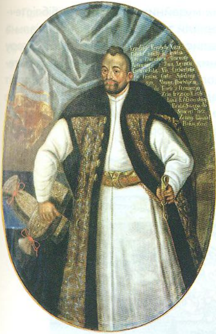
Князь Криштоф Збараський (1579-1627). XIX ст. Полотно, олія. НМІУ