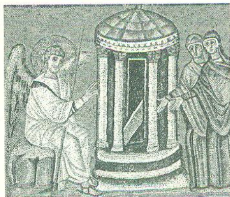
Рис. 1. Мозаїка VI ст. з базилики св. Аполлінарія Нового в Равенні: ангел звіщає Ісусове воскресіння жінкам, що стоять коло спорознілої гробниці

Яка ж була та первісна Церква, що її бажав Ісус? Насамперед слід погодитися з висновком Мартіна Генделя*, «що в порівнянні з іншими обшарами й епохами в античній історії [...], джерельна база до історії перших десятиліть християнства, від Йоана Хрестителя до Неронових гонінь або й до початку Юдейської війни [66 р. по Хр.], в принципі не така вже й погана». 2 Адже, крім книг Нового Завіту, тобто «Євангелій, Апостольських діянь і автентичних та вторинних Павлових послань [...], існує чимало інших, переважно псевдоєпіграфічних творів, які датуються десь у 70–110 рр. по Хр. і з яких можна робити висновки про епоху „заснування Церкви“; сюди можна додати й [ранньохристиянські] оповіді, наведені в Папія, Гегесипа і Євсевія, а також окремі звістки [нехристиянського походження] в Йосифа Флавія, Тацита, Светонія, Плінія Молодшого і в рабинічній традиції». 3 Крім того, за додатковий, допоміжний матеріал для історичної реконструкції можуть послужити дані про тогочасний юдейський та елліністичний світ, почерпнуті з Кумранських рукописів (пор. рис. 2), гностичних текстів із Наг-Хаммаді та багатьох інших написів і папірусів. Звісно, при інтерпретації новозавітних джерел варто мати на увазі, що їх укладачі вважали себе «історіографами» або, радше, «оповідачами