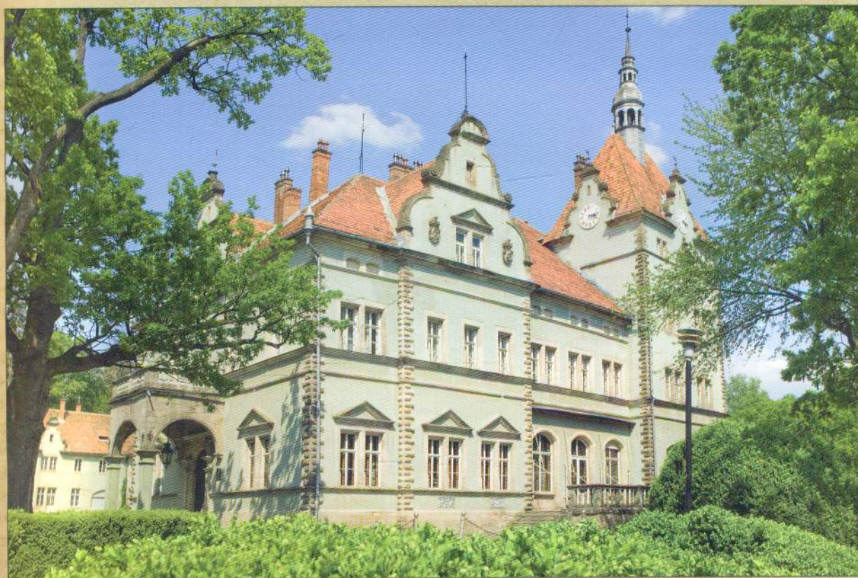
∞ Палац графів Шенборнів, с. Карпати, Мукачівський р-н, Закарпаття