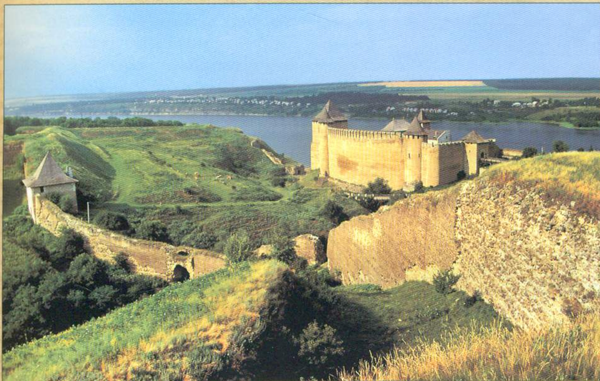
∞ Хотинська фортеця — фортеця XII–XVIII ст. у місті Хотин на Дністрі, що у Чернівецькій області