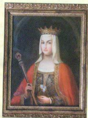
☞ Ярослав Мудрий ☞ Анна Ярославна