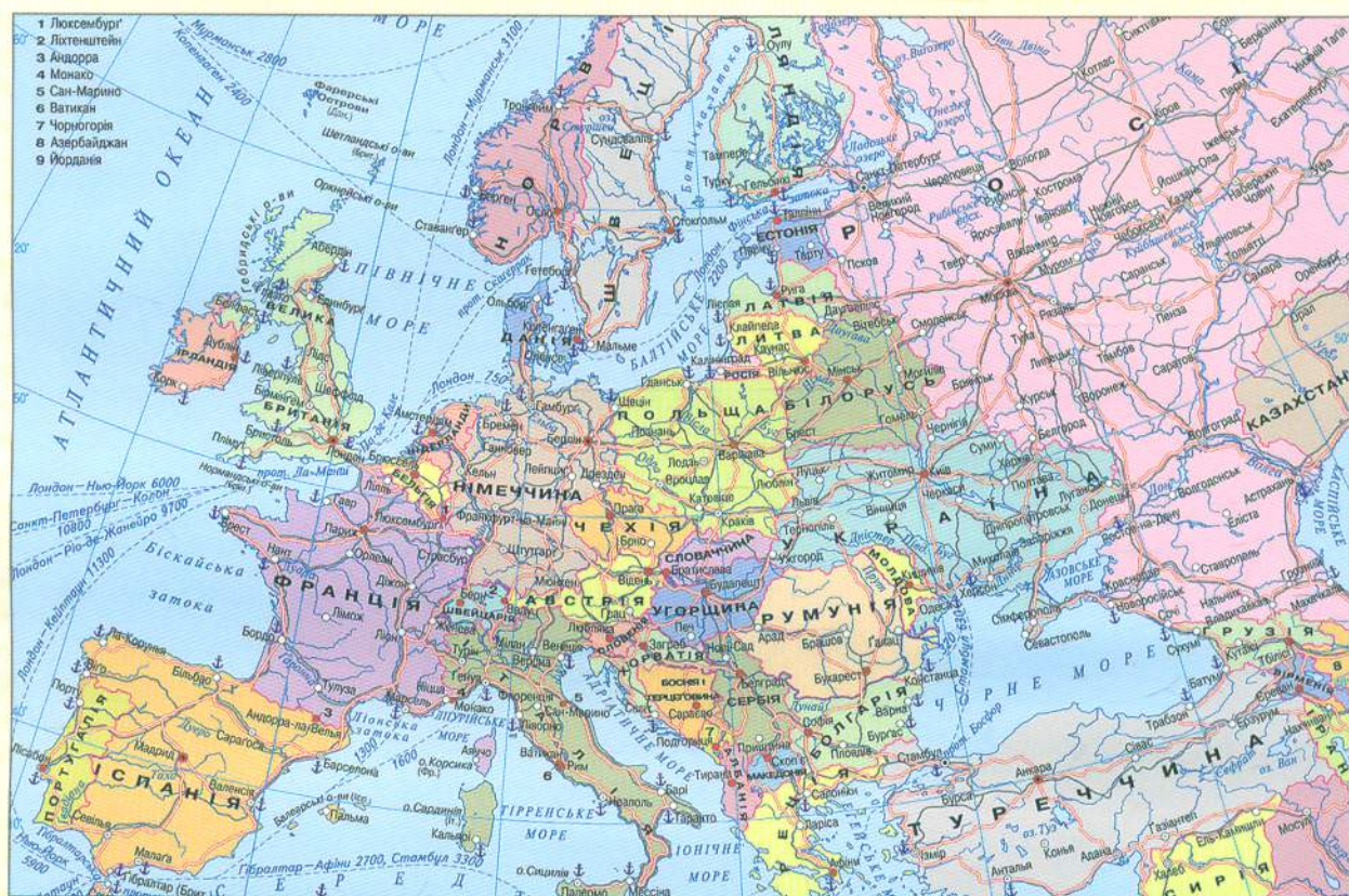
Україна на мапі Європи

Україна — найбільша держава в Європі. Друге місце за величиною посідає Франція, третє — Іспанія. Площа України вдвічі більша за площу Польщі, у п'ять разів — за площу Греції, і в двадцять — за площу Бельгії. Крайня західна точка України розташована біля закарпатського міста Чоп, крайня східна — біля Луганська, крайня північна — біля Чернігова, а крайня південна — на мисі Сарич у Криму.