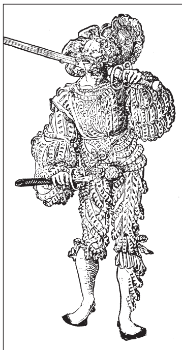
Ландскнехт. Дереворит Петера Фльотнера