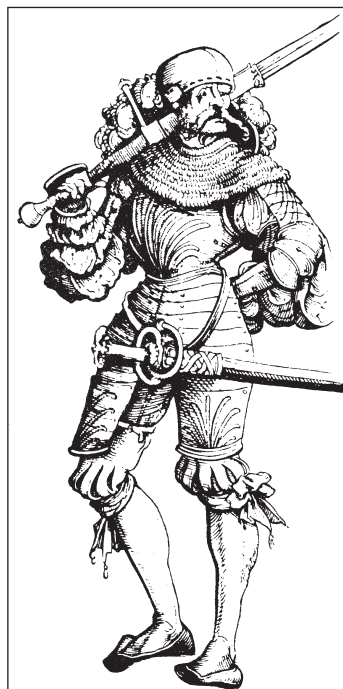
Солдат. Гравюра на міді Ганса Буркмайра

щачи навіть ті слабкі паростки порозуміння, що перед тим вдавалося виплекати з неймовірними труднощами.