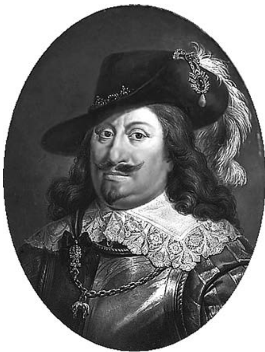
Польський король Владислав IV. Художник Марчелло Баччареллі

У перших числах квітня 1646 р. до Варшави прибули представники козацької старшини — військові осавули Іван Барабаш та Ілляш Караїмович, полкові осавули Максим Несторенко, Роман Пешта і Ясько Клиша, а також колишній військовий писар, а наразі чигиринський сотник Богдан Хмельницький. Король зустрівся з козацькою старшиною таємно вночі у власній світлиці. У нічній аудієнції, крім короля й козацької старшини, також брали участь семеро найбільш близьких до Владислава IV сенаторів. Крім того, згідно з інформацією утаємничених королівського двору осіб, у розмовах короля з козаками взяв участь і посол Венеціанської республіки, уряд якого був кривно зацікавлений у вибуху великої війни з Османами. Агітуючи козаків на королівську службу, монарх обіцяв удвічі збільшити число реєстрових козаків, довівши його до