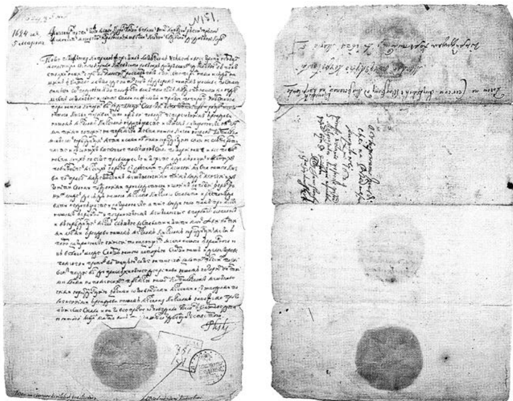
Королівський позов на суд. 1624 р.

Справжню ціну цієї безкоштовної королівської поради козацькому старшині оцінили вже наступники короля, побачивши на власні очі всі ті нещастя королів-