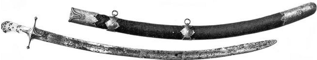
Шабля Богдана Хмельницького. Із колекції В. Тарновського

Велике враження на козацтво справляли полум'яні заклики чигиринського сотника. А ще більше — його розповіді про те, що він має королівську корогву й листа від Владислава IV, де той визнає старожитні козацькі права й привілеї. Отож, коли 25 січня 1648 р. Хмельницький на чолі свого невеличкого війська рушив на Микитинську Січ, пускати в хід шаблю не було потреби — на його бік перейшли не лише запорозькі козаки, а й реєстровці Черкаського полку, що перебували там як залага. Спроба черкаського полковника Станіслава Вадовського й чигиринського — Станіслава Кричевського з реєстровцями, що лишилися під