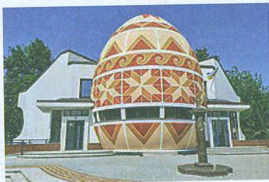
Музей «Писанка» в Коломиї (Вікіпедія)