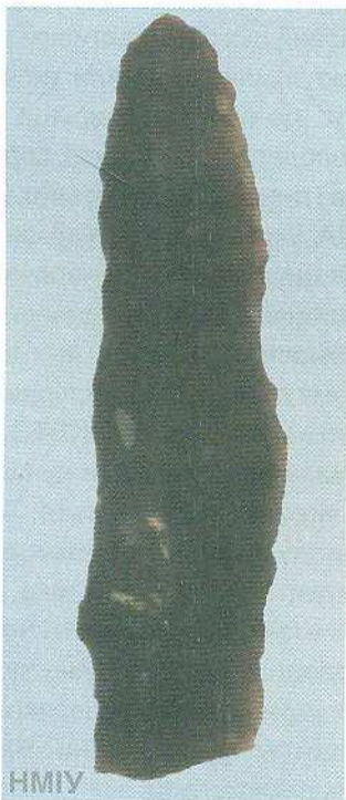
Мисливська зброя. Бойова частина вістря стріли. 13 600 років тому. Пізній палеоліт. Село Семенівка, Київська область

У скандинавській міфології, корені якої сягають дуже давніх часів, є образ могутнього бога Тора. Переможець крижаних велетнів мав на озброєнні чарівний бойовий молот, здатний знищити будь-якого ворога. Диво-зброя завжди поверталася до господаря, її можна було мета-