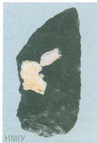
Мисливська зброя. Гостроконечник крем'яний. 70 тис. років тому. Середній палеоліт. Кабазі V. С. Малинівка, Крим

ти знову й знову. Цілком реальні прототипи легендарного молота було вперше розроблено (і широко застосовано) на теренах Європи наприкінці VI тис. до н. е, тобто приблизно сім тисяч років тому, після чого впродовж майже трьох наступних тисячоліть вони залишалися на озброєнні воїнів багатьох племен. Це була історична подія, адже від тих часів можемо вести відлік доби спеціалізованої зброї, призначеної виключно для війни. Її застосування вимагало нових навичок, постійних тренувань, нарешті, певних зрушень у свідомості — як того, хто її застосовував, так і суспільства в цілому, яке долучилося до процесу, називаного словом «війна». Бойова сокира-молот швидко стала символом влади, її постійно вдосконалювали — на зміну каменю прийшов метал (спочатку мідь, потім — бронза, далі — залізо), невідомі нам «конструктори» розробляли нові обриси — більш смертоносні і водночас такі, що вабили досконалістю форм. Так народжувалася та магія зброї, яка не залишає байдужим та бентежить і сьогодні кожного, хто споглядає зброю або торкається до неї.