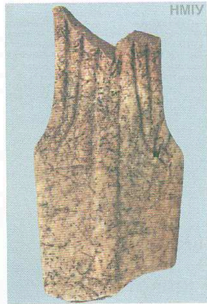
Кинжал кістяний (фрагмент). Кінець IV тис. до н. е. Трипільська культура. С. Грим'ячка, Хмельницька область

Разом із тим виявляється, що описана ще давньоримськими авторами тактика ведення бою германців та слов'ян, а також притаманний їм комплекс озброєнь сягають часів існування (до речі, на тій самій території) культури кулястих амфор, а це III тис. до н. е. Притаманний згаданій культурі комплекс озброєнь: лук зі стрілами, дротики, сокира для ближнього бою — збігається до дрібниць (із тією лише різницею, що кремій, камінь та кістку у виготовленні озброєння через чотири тисячі років було замінено на залізо).