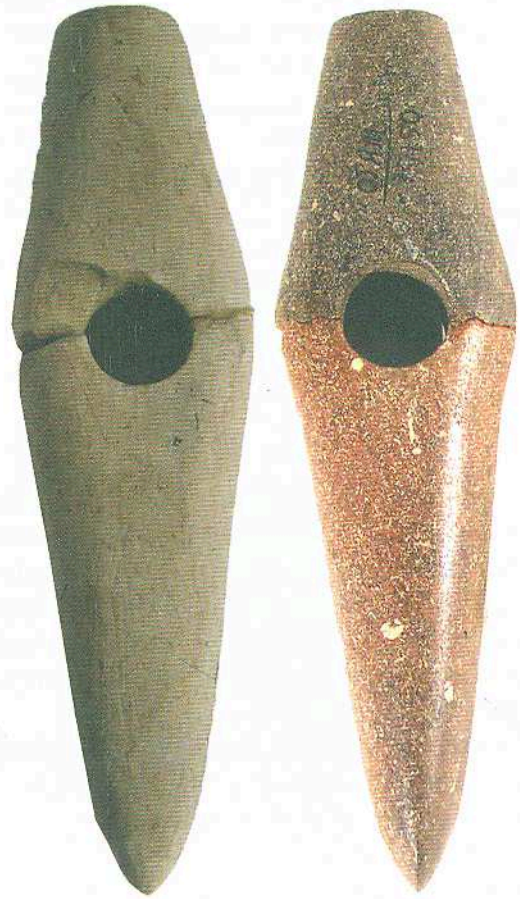
Сокири-молоти, камінь. Трипільська культура, кінець VI — початок V тис. до н. е.

1 — поселення Окопи, Тернопільська область; 2 — поселення Олександрівка, Одеська область