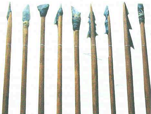
Стріли з крем'яними вістрями. Мезоліт (IX—VIII тис. до н. е.). Реконструкція Д. Нужного, Археологічний музей Інституту археології НАН України, Київ

вояків. У культурній спільноті Кукутень-Трипілля наприкінці V — у IV тис. до н. е. з'являються союзи племен — вождівства, здатні виставити по кілька тисяч воїнів (в окремих випадках до 3—7 тисяч). Ураховуючи концентрацію населення в протомістах (налічували до 15 тисяч мешканців), контингент у кілька тисяч вояків було зосереджено в окремому місці. До найбільш потужних складних вождівств долучалися сусіди-союзники, загальна кількість ополчення в такому випадку могла теоретично сягати 10 тисяч і більше осіб.