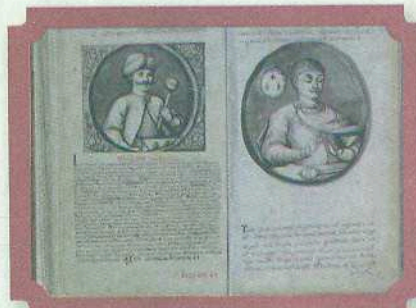
Сторінки з «Літопису Самійла Величка»