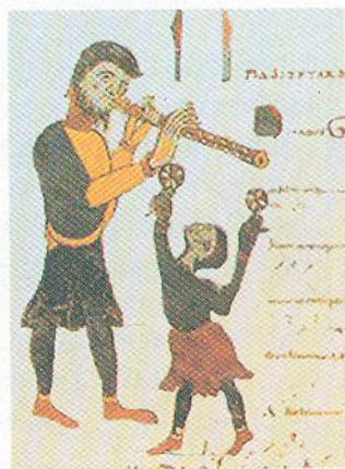
Жонглери. Мініатюра. ХІІ ст.

Записувати, збирати й художньо обробляти зразки народної творчості почали напри-