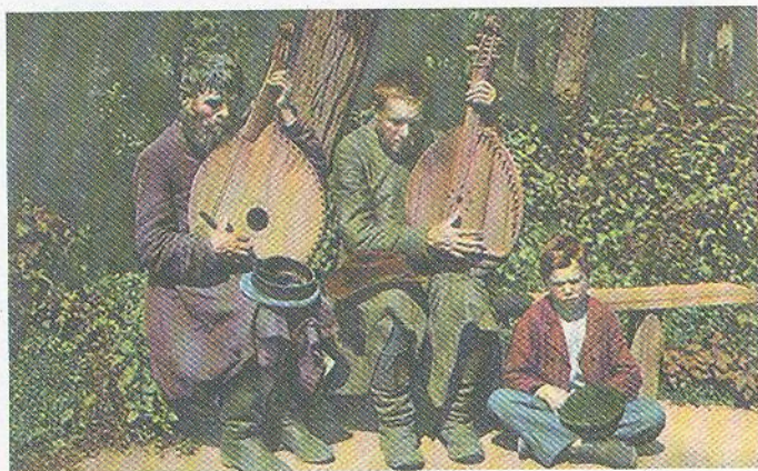
Кобзарі. Листівка. Початок ХХ ст.