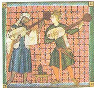
Мусульманський та християнський музиканти. Мініатюра. ХІІІ ст.