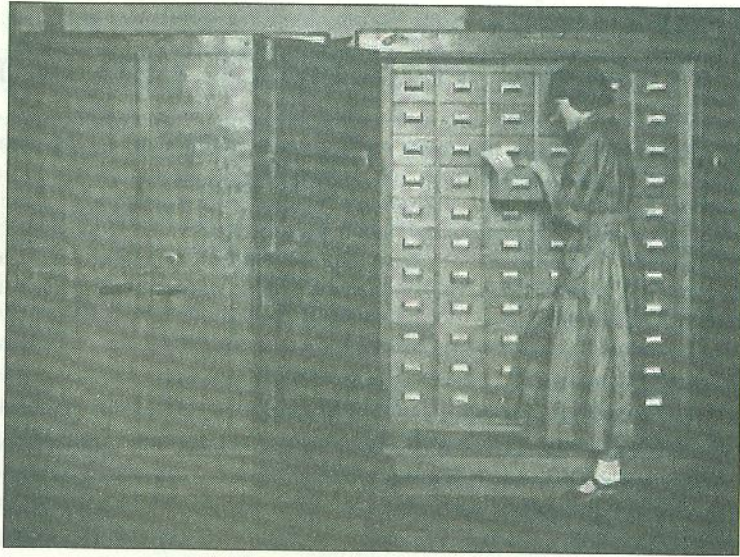
Картотека відділу архіву НКВД СРСР, 1939 р.

масив документів залишився у віданні теперішньої спецслужби, і, як показують події останніх років, перетворився на заручника політичної ситуації в країні.