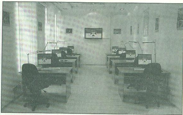
Інформаційно-довідковий зал Відкритого електронного архіву СБУ, 2008 р.

ву-формуляр на Миколу Хвильового, розпочато підготовку до друку справи Олександра Довженка.