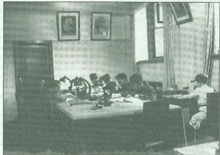
Читальний зал архіву НКВД СРСР, 1939 р.

Весь масив історичних документів Архіву СБУ (а це понад 800 тисяч справ, окремі справи містять по кілька десятків томів) згрупований за фондами, що об'єднують матеріали за видами і темами. Найбільшим є масив кримінальних справ — сотні тисяч свідчень про жертв масових політичних репресій 1920—1950-х років, наступного витка терору проти інакодумців у 1960—1980-х. Перелік прізвищ діячів української історії, щодо яких наявні кримінальні справи, зайняв би кілька сторінок, тому назву лише найвідоміших із різних періодів — Юрій Тютюнник, Сергій Єфремов, Микола Куліш, Василь Кук, Катерина Зарицька, Василь Стус, В'ячеслав Чорновіл. Ці документи чи не найкраще показують масовість антирадянського опору в країні і те, що режим протягом усього часу існування СРСР тримався на насильстві супроти своїх громадян.