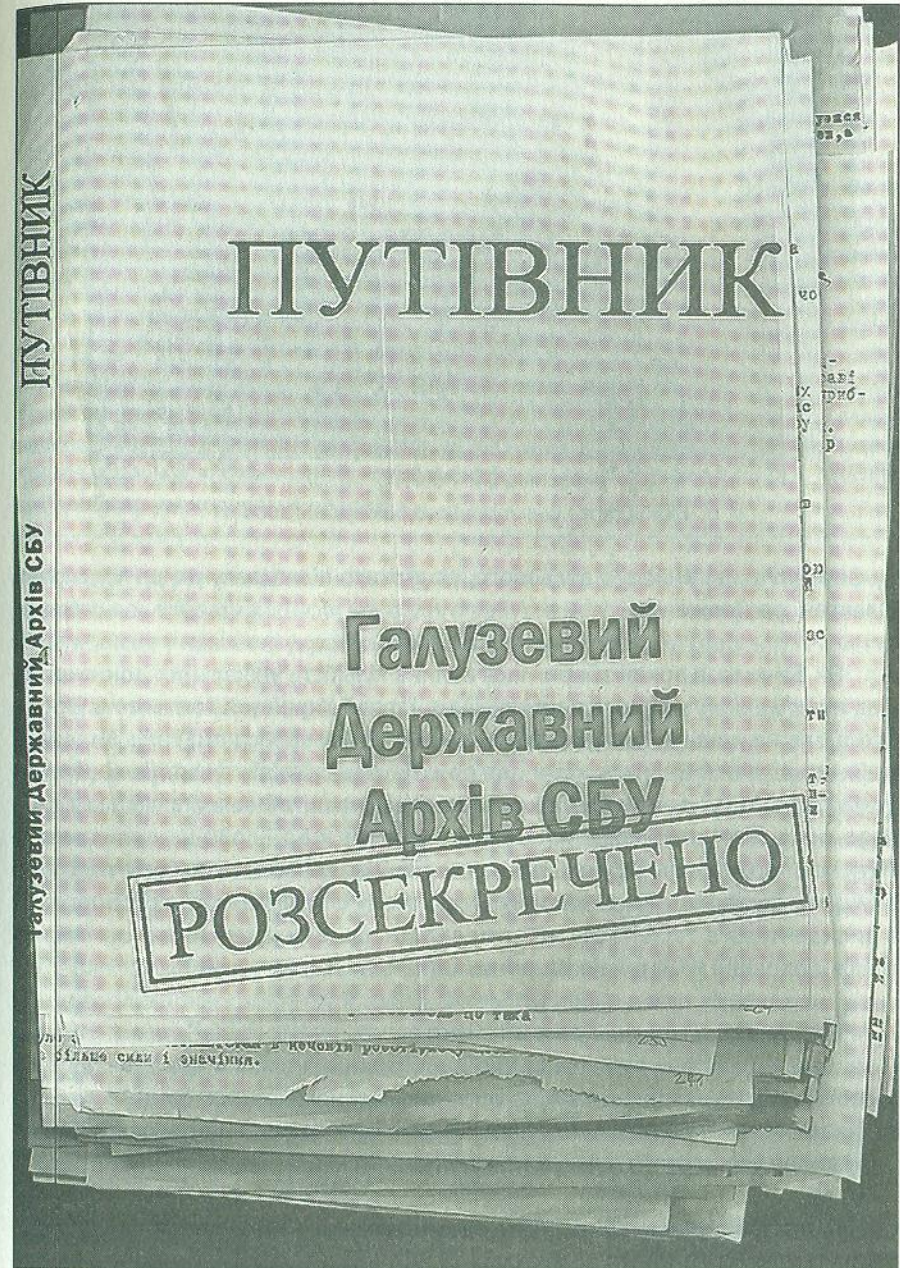
Путівник по матеріалах Архіву СБУ.