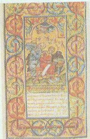
Сторінка з Пересопницького Євангелія

Розмірковуючи над унікальним впливом викладеного в Новому Заповіті вчення Ісуса Христа, історик Філіп Шафф у своїй книзі «Особистість Христа» зазначає: