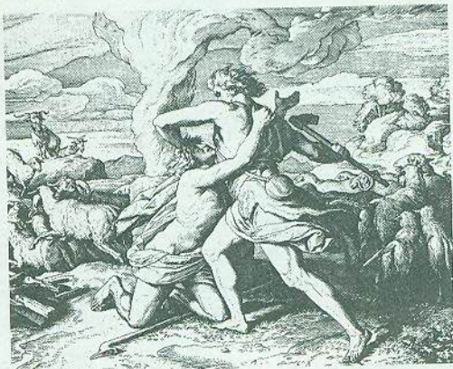
Юліус Шнорр фон Карольсфельд. Про заздрість (Каїн та Авель)

Алегоричною побудовою характеризуються також притчі Ісуса Христа, уміщені в Новому Заповіті. Польові квіти, засохла смоква, занедбане поле – за допомогою таких алегорій Христос пояснював сутність проповідуваного вчення. ❖