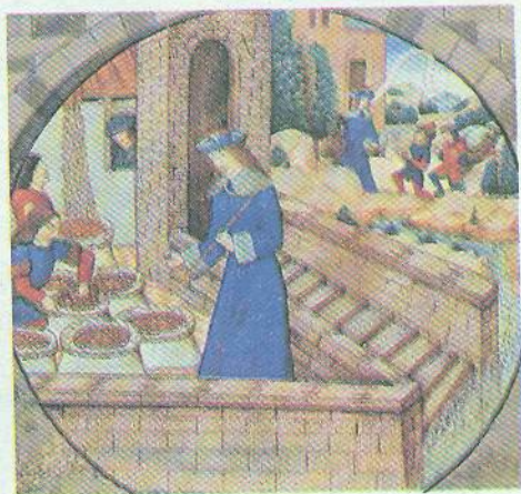
Йосип керує Єгиптом. Мініатюра. XV ст.

Одного разу брати погнали отари випасатися далеко від батьківської оселі. Батько послав Йосипа відвідати їх. Та щойно вони побачили юнака в подарованому батьком чудовому квітчастому вбранні, як в їхніх серцях з новою силою закипіла ненависть, і вони вирішили вбити Йосипа. Намагаючись урятувати Йосипа, старший брат Рувим переконав братів кинути його в яму. Саме тоді через цю місцевість ішов караван чужоземних купців, і брати продали їм Йосипа в рабство. Потім вони поділили отримані за Йосипа гроші та забруднили його вбрання кров'ю зарізаного козеняти, аби переконати батька в тому, що Йосипа розірвали дикі звірі. Страшна новина розбила батькові серце. У великому горі Яків розірвав на собі одяг (так, за давньою традицією, євреї уви-