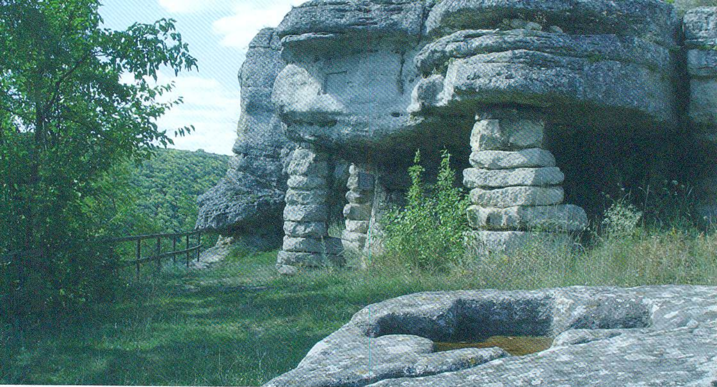
Monastyrok, Borshchiv district, Ternopil region.

B orshchiv district is a picturesque land of Podillya which lies along the left bank of the Dniester in Ternopil region. This land has from time immemorial been adequate for living, it attracted people with its tender sleep. Throughout history various cultures developed, thrived and disappeared with time in this territory, leaving tacit witnesses of the history of the land which were so rich in information. Plenty of monuments of olden time, in particular, those of paleolith (100,000 — 10 thousand years ago), late Stone Age (6 — 4 thousand years