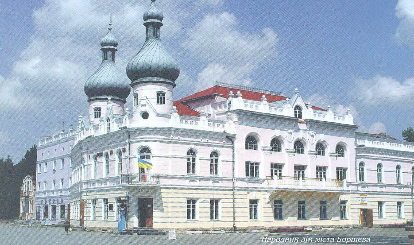
Народний дім міста Борщева

Б орщівщина — мальовничий край Поділля, що розкинувся уздовж лівого берега Дністра на Тернопільщині. Ця земля від найдавніших часів була придатною для життя, приваблюючи людей своїм лагідним підсонням. Упродовж сотень тисяч літ на цій території розвивалися, процвітали і з часом зникали різні культури, залишаючи по собі мовчазних, але таких виразно багатих на інформацію свідків історії краю. Багато пам'яток давнини, зокрема, палеоліту (100000 — 10 тис. років тому), неоліту (6 — 4 тис. років тому), Трипільської культури (5 — 3 тис. років тому) відкрили археологи поблизу сіл Більче-Золоте, Бережанка, Білівці, Боришківці, Верхняківці, Глибочок, Вигода, Кривче, Устя, Пилипче, Гермаківка та багатьох інших. Без сумніву, ці реабілітовані сучасністю артефакти, що впродовж тисячоліть поверталися на поверхню землі з минулого, нащадки щоразу сприймали як образи-символи нерозривності зв'язків між минулим і майбутнім, ремеслом і мистецтвом. Ще раніше, ніж археологи, знаходили на своїх землях місцеві мешканці розписані магічними знаками-символами глиняні горщики чи їхні фрагменти. Таке своєрідне послання нащадкам із культурних глибин минулих епох та нагадування сучасникам про найважливіші віхи історії світової цивілізації давало потужний імпульс народженню нових образів, творчому переосмисленню на новому щаблі часу магічних, не завше розшифрованих знаків.