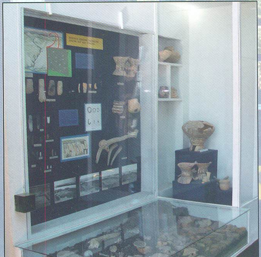
Експозиція краєзнавчого музею, м. Борщів, Тернопільська обл.