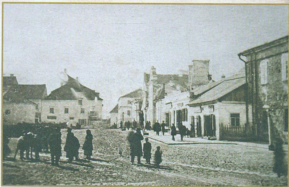
Велика площа м. Кам'янця-Подільського, адміністративного центру Подільської губернії. 1860-ті рр.

Доброчинності» (Санкт-Петербург, відомі імена 634 членів).