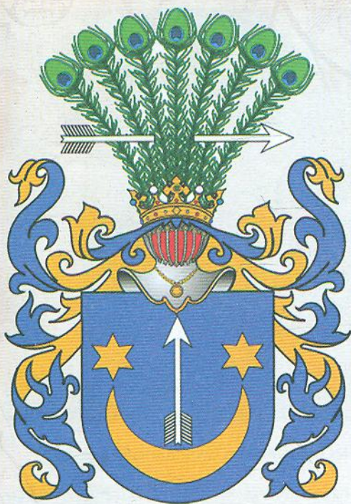
Герб Сас. Суспільне надбання

Вінницької гімназії (1820 р.), Крем'янецького ліцею (1825 р.). Учасник з'їзду «Народного патріотичного товариства» та російських «декабристів» (м. Житомир, 1825 р.), прихильник ідеї державної незалежності «Малоросії». Учасник антиімперського, національно-визвольного Листопадового повстання 1830—1831 рр., відбув ув'язнення (1830—1832 рр.). Проживав у власному маєтку в с. Махнівці (сучасне с. Комсомольське Козятинського району Вінницької області) Бердичівського району Житомирської області.