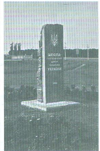
Рис. 2. Географічний центр України