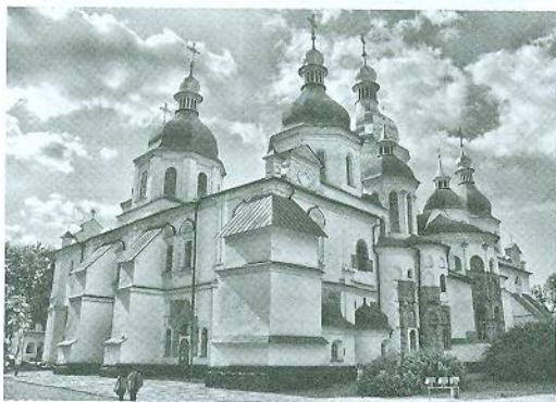
Софійський собор у Києві. Перша половина XI ст.

Зведений за часів Ярослава Мудрого як кафедральний собор, був резиденцією православних і греко-католицьких митрополитів.