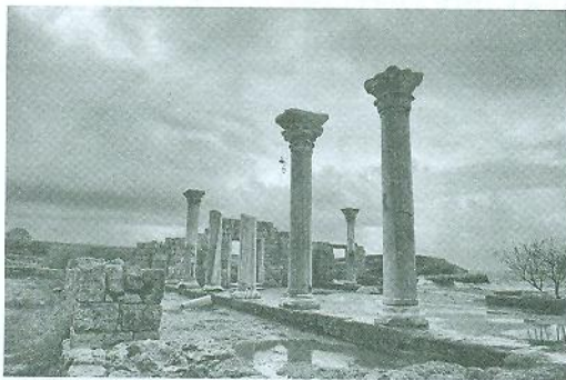
Херсонес Таврійський. V ст. до н. е. – VI ст. н. е.

Античний і візантійський поліс (місто-державу) на території сучасного Севастополя, що увійшов до списку світової спадщини ЮНЕСКО. Місто, назва якого перекладається як «півострів», засновано колоністами з Гераклеї Понтійської. Нині в Русі відомий як Корсунь, де 988 р. хрестився князь Володимир.