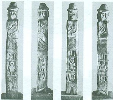
Збруцький ідол. IX ст.

Античний і візантійський поліс (місто-державу) на території сучасного Севастополя, що увійшов до списку світової спадщини ЮНЕСКО. Місто, назва якого перекладається як «півострів», засновано колоністами з Гераклеї Понтійської. Нині в Русі відомий як Корсунь, де 988 р. хрестився князь Володимир.