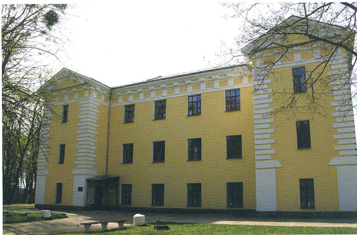
Фасад палацу в П'ятничанах.

дерев'яні церкви, це було звичною практикою). З'явилися нові стайні, майданчик для возів і карет, майстерні, голуб'ятня.