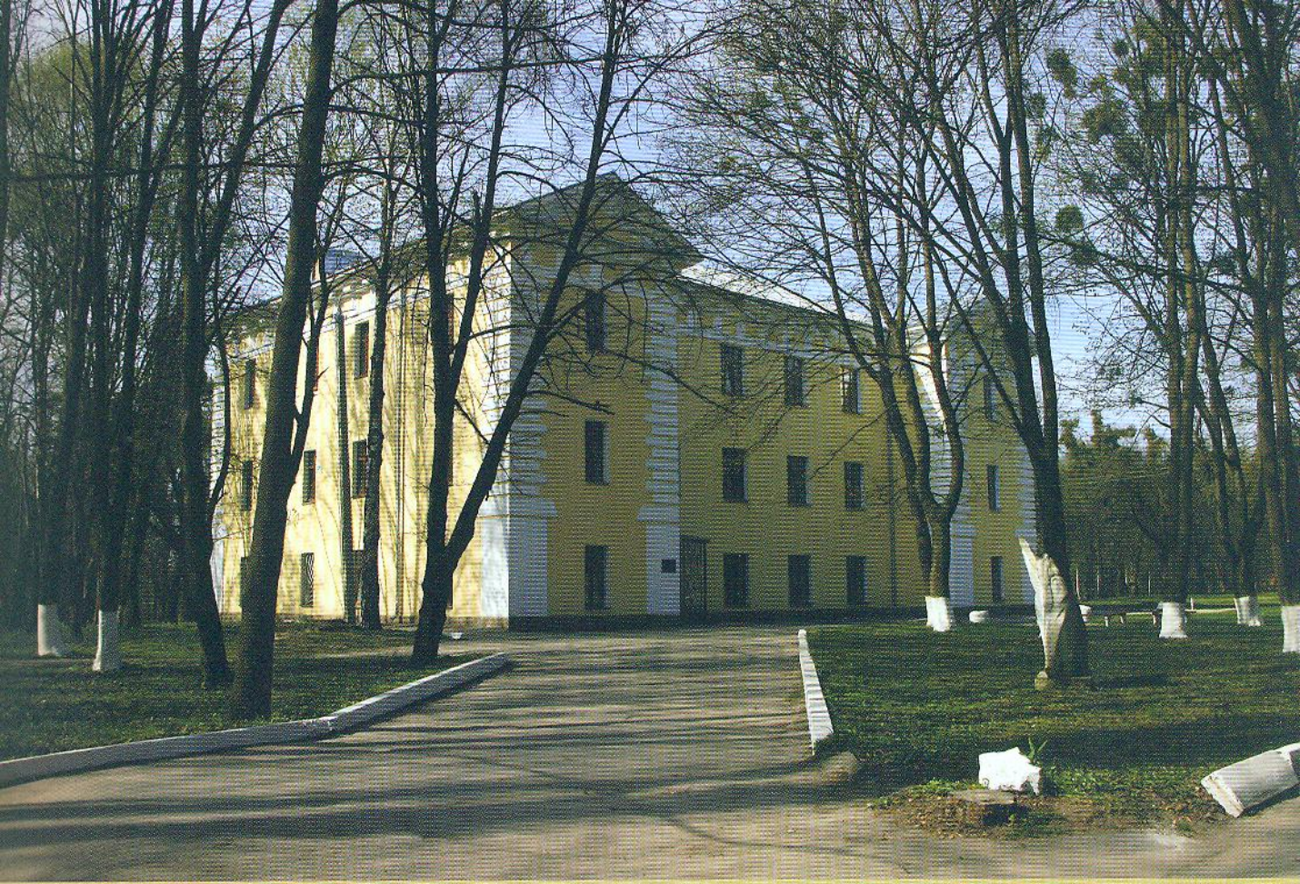
Замок-палац у П'ятничанах у наші дні.