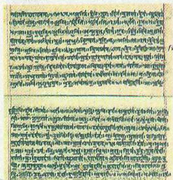
Рукопис Рігведи. Початок XIX ст.

праведність і доброта, щирість і святість слова тощо. Саме тому вони й нині на часі. Надзвичайно актуальним для сучасного світу є біблійний заклик до миру й милосердя. Прийнятні як правила поведінки, що сприяє порозумінню, заповіді Корану. Важливі для нашого часу оптимістичні й гуманістичні 1 гімни Вед про самоцінність людини, про любов та єдність із природою.