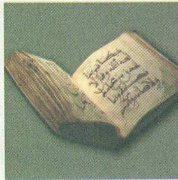
Північноафриканський Коран. XI ст.

Ідеї та образи священних книг вплелися в тканину фольклору народів світу, лягли в основу крилатих висловів, прислів'їв і приказок. І нині в повсякденному мовленні побутують біблійні рядки («Хто не працює, той не їсть», «Не судить, не судимі будете», «Немає пророка у своїй вітчизні», «Час жити і час помирати», «Зарити талант у землю», «Не хлібом єдиним», «Кесарю – кесарево», «Соломонове рішення»), живуть виразні визначення та барвисті алегорії з Корану («Рай біля ніг матері», «Кому даровано мудрість – тому даровано вище благо», «Прагніть випередити один одного в добрих справах»).