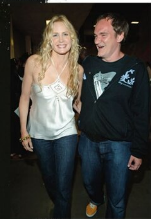
ВГОРІ. З Деріл Ганна, для якої він написав роль Ельї Драйвер з «Убити Білла» (2003)

на сцені та особисто повідомити, що написав під мене роль. Ми не були знайомі. Розказав, що побачив мене в телефільмі, назви якого я навіть не пам'ятала. Я подумала: «Ну звісно, вас знімає прихована камера». Я не знала, вірити чи ні, але через кілька місяців Квентін надіслав сценарій. Неймовірно.