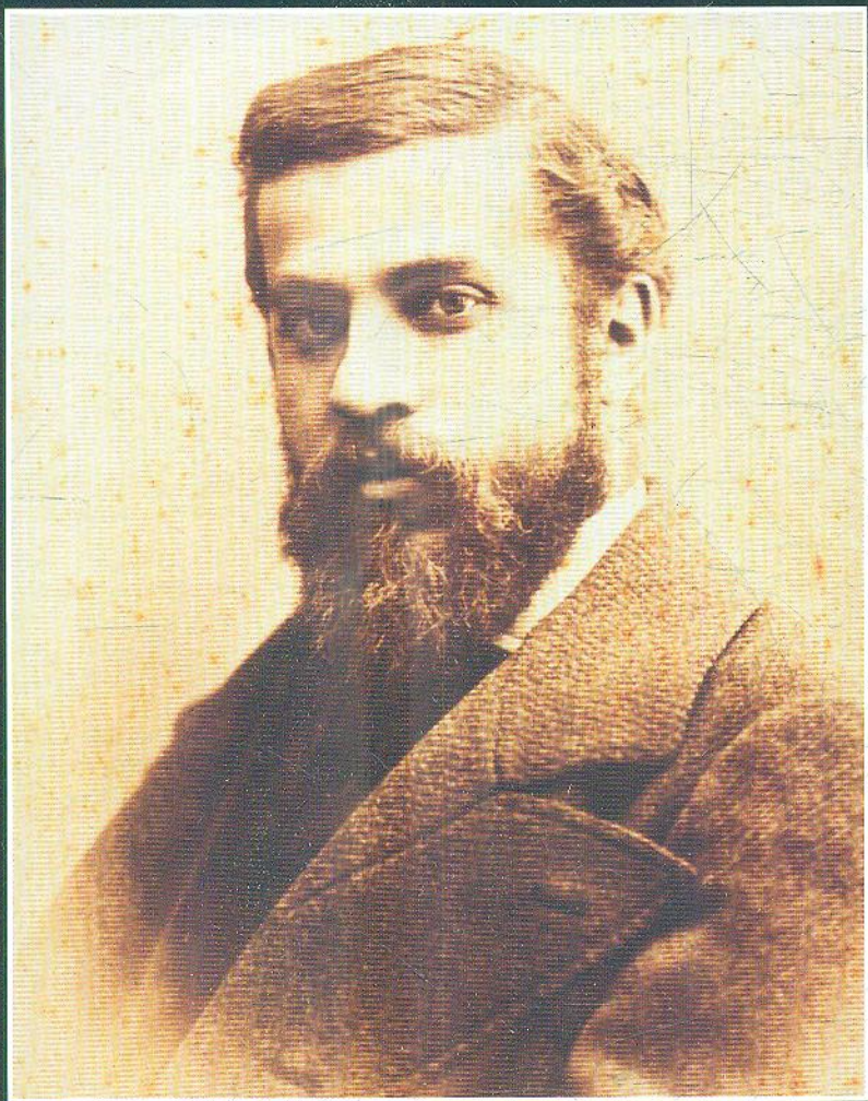
Портрет Антоні Гауді Пабло Аудуард Деглер, приблизно 1882 р. Приватна колекція