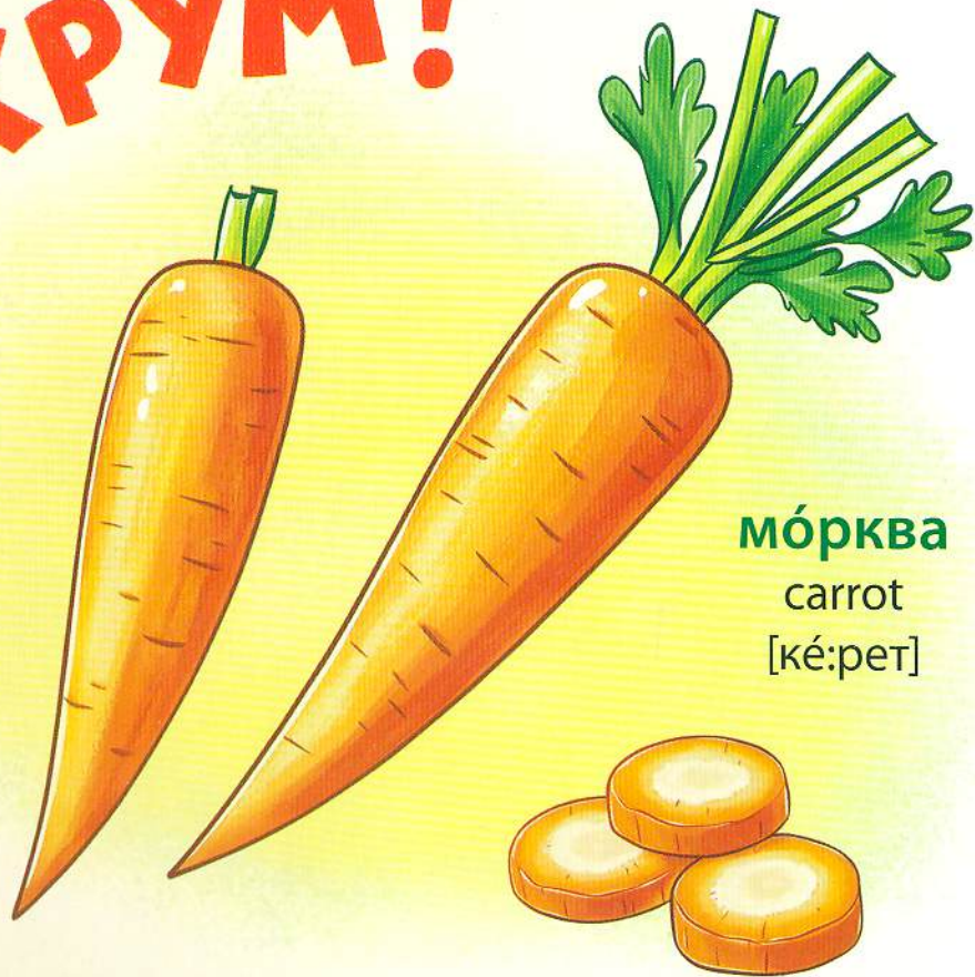
мóрква carrot [ké:pet]