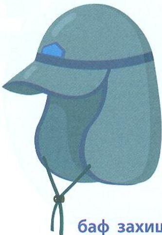
баф захищає ще й шию