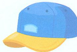
і звісно звичайна кепка

Як скласти таку кепку з паперу, дивися у нашому відео.