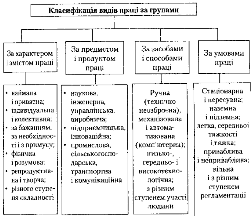
Рис. 3. Класифікація видів праці

Зміст праці — узагальнена характеристика процесу праці, яка враховує різноманітні функції праці, види трудових операцій, поділ виробничої діяльності за галузями, фізичне та інтелектуальне навантаження учасників процесу праці, ступінь самостійності працівника у регулюванні послідовності трудових операцій, наявність або відсутність новизни, творчості, складності, технічну оснащеність праці тощо.